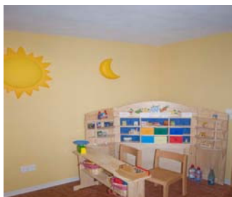
Spielzimmer mit Kinderkino, Internetstation, Kleinkinderbereich, Spielraum, Rutsche, Kaufladen u.v.m.