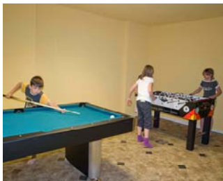
Freizeitbereich mit Tischtennis, Billard, Tischfußball, Internetstation