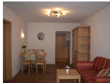
Wohn- & Eßbereich